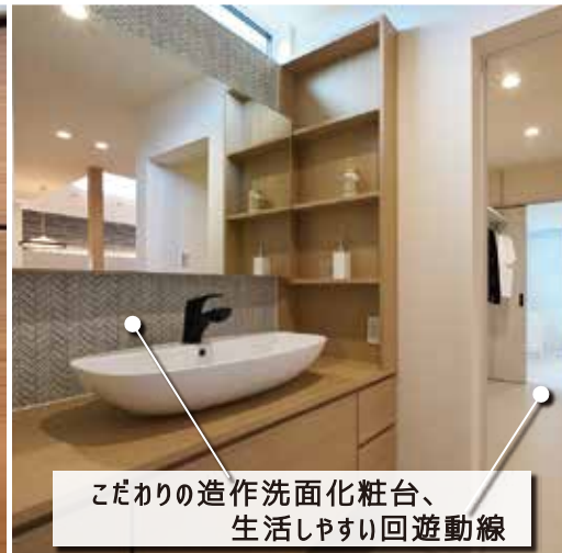
こだわりの造作洗面化粧台、生活しやすい回遊動線