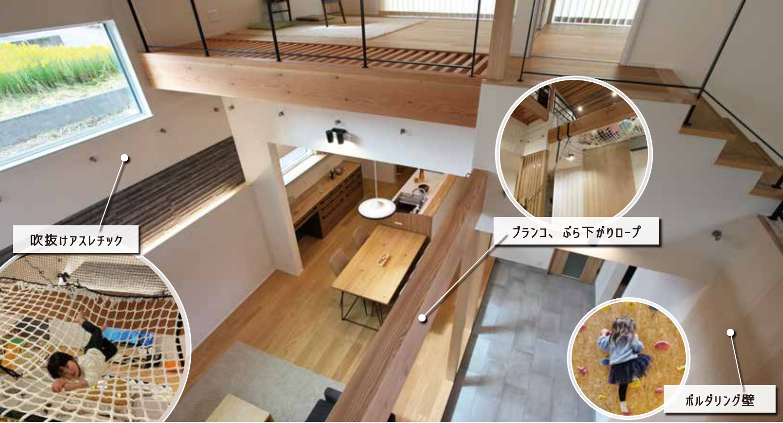
吹抜けアスレチック