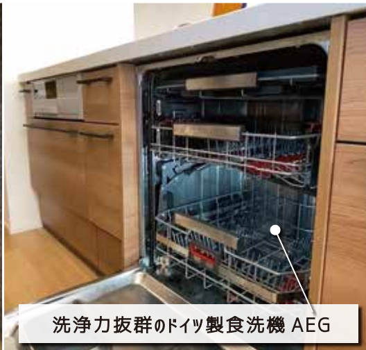
洗浄力抜群のドイツ製食洗機 AEG