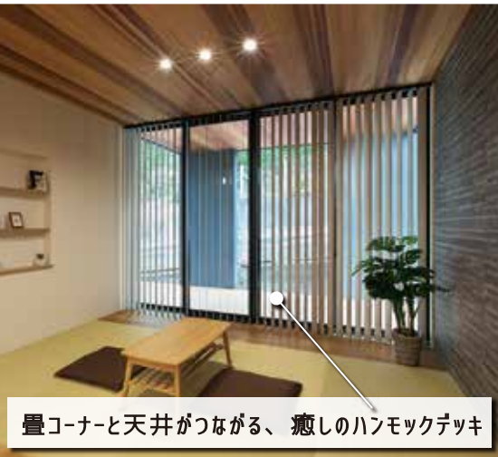
畳コーナーと天井がつながる、癒しのハンモックデッキ