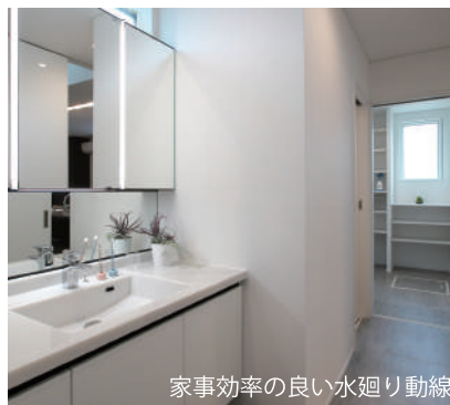
家事効率の良い水廻り動線