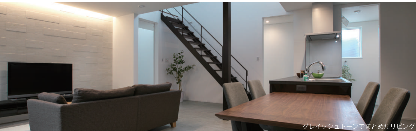
グレッシュトーンでまとめたリビング