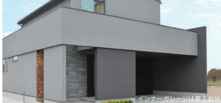
インナーガレージは車2台分