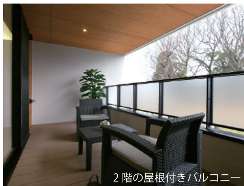
2階の屋根付きバルコニー

家を建てるのに今が一番お得なのはご存じですか？ 気になる資金のことや、住宅ローン減税について詳しくは現地スタッフにお尋ねください。