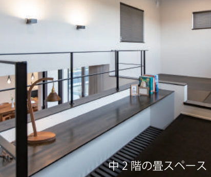
中2階の畳スペース